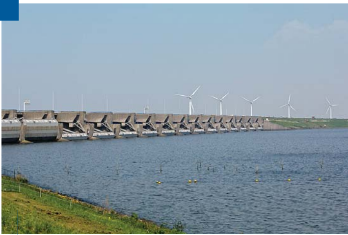
Het Haringvliet verzilt met het openen van de sluisen